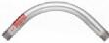
โค้ง 90 IMC