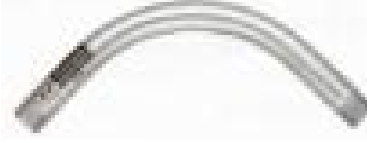
โค้ง 90 RSC