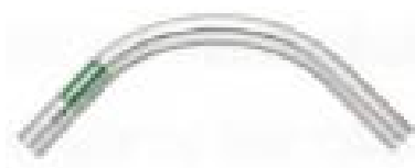
โค้ง 90 EMT